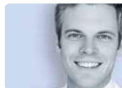
Dr. Rafael Hasler Implantologie, Oral- chirurgie